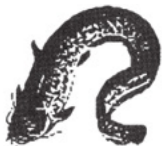
Mal Wels Catfish