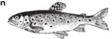
ÖR = Bäcköring Bachforelle Trout