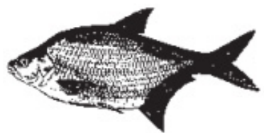
BR = Braxen Brachsen Bream