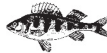
AB = Abborre Barsch Perch