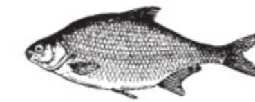
BJ = Björkna Güster Silver Bream