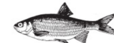
MÖ = Mört Plötze Rotauga Roach