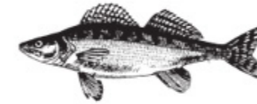
GÖ = Gös Zander Pike-perch