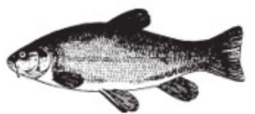
SU = Sutare Schleihe Tench