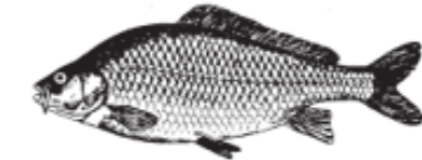
KA = Karp Karpfen Carp