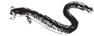
ÅL = Ål Aal Eel