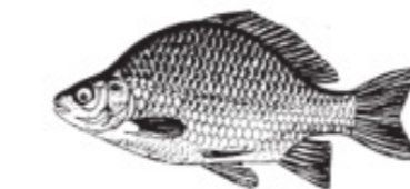
RU = Ruda Karausche Crucian Carp