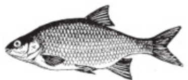
SA = Sarv Rotfeder Rudd