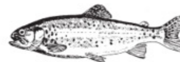
RB = Regnbågslax Lachsforelle Rainbowsalmon