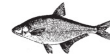
FA = Faren Zope Silver bream