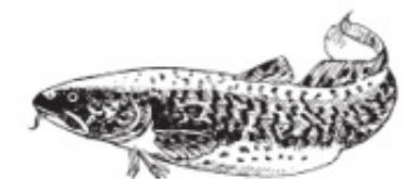
LAK = Lake Quappe Burbot